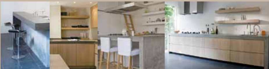
huiselijk, gezellig, beweging, samen, overzichtelijk