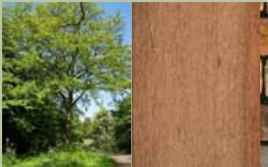
natuurlijke uitstraling, duurzaam, ecol