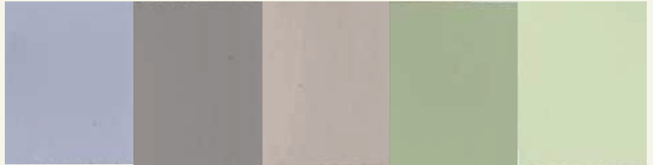
lichte natuur tinten, warm, huiselijk, geborgen