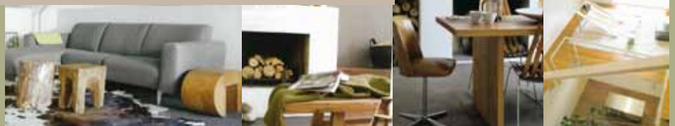
huiselijk, comfortabel, knus, open